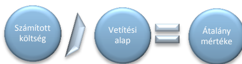
1. ábra A százalékos átalány mértékének meghatározása

Az egyedi módszertanon alapuló százalékos átalány alkalmazásakor egyes, a projekt végrehajtása során felmerült elszámolható költségek változatlanul, eddig megszokott módon valós költség alapon, alátámasztó dokumentumokkal kerülnek elszámolásra, míg más költségek egy előre meghatározott százalékos mértékig, alátámasztó dokumentumok nélkül, technikai számla alapján kerülnek kifizetésre. Az egyedi módszertanon alapuló százalékos átalány elszámolás alkalmazása esetén a valós költség alapon elszámolandó költségeket vetítési alapnak , míg az átalányban elszámolható költségeket számított költségeknek nevezzük. Azt, hogy mely költség melyik kategóriába tartozik, minden esetben a felhívás határozza meg, attól eltérni a projekt megvalósítása során a kedvezményezetteknek nem lehetséges.